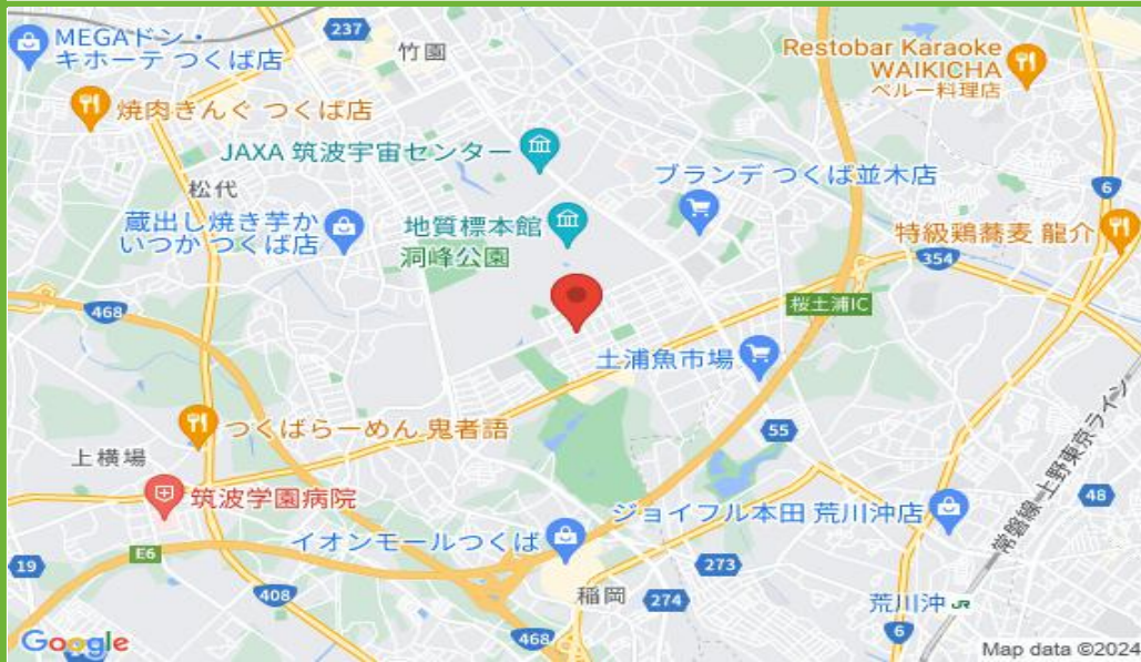
ダイロク駐車場配置図