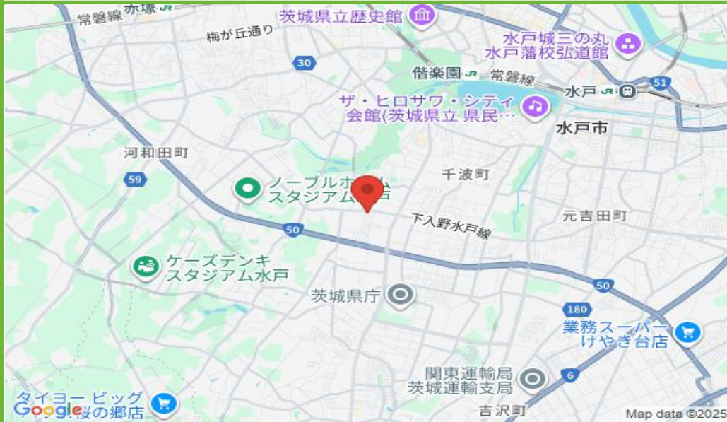
千波町2269-1駐車場 茨城県水戸市千波町2269-1