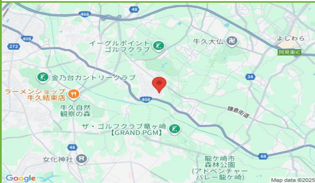
小坂町駐車場 茨城県牛久市小坂町2006-85