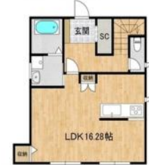
ひだまりのトラオム・夢